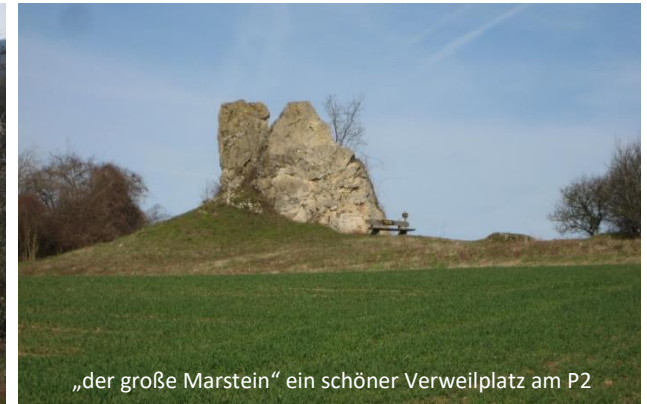
„der große Marstein“ ein schöner Verweilplatz am P2