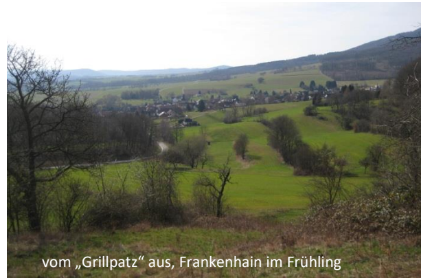
vom „Grillplatz“ aus, Frankenhain im Frühling