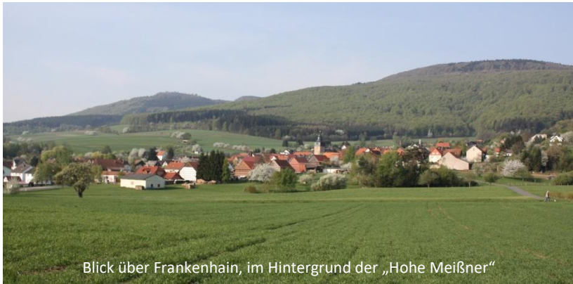
Blick über Frankenhain, im Hintergrund der „Hohe Meißner“